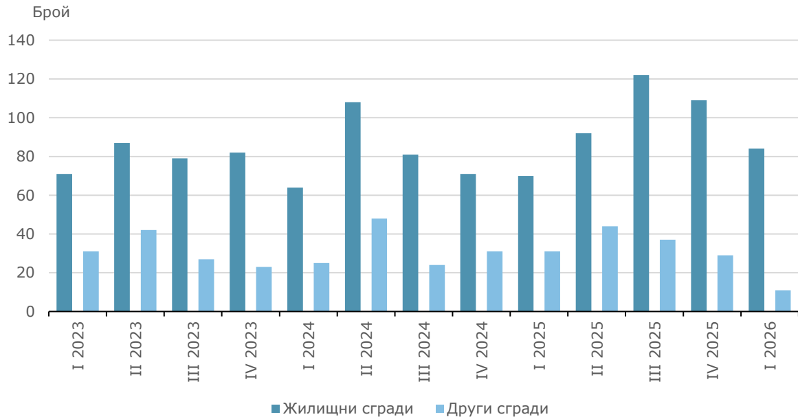
Фиг. 3. Започнато строителство на нови сгради по видове сгради и тримесечия

В сравнение с първото тримесечие на 2025 г. започнатите нови жилищни сгради се увеличават с 20.0%, жилищата в тях - с 9.8%, както и общата им застроена площ - с 9.4%. При започнатите други видове сгради се наблюдава намаление с 64.5%, а при общата им застроена площ - със 75.8%.