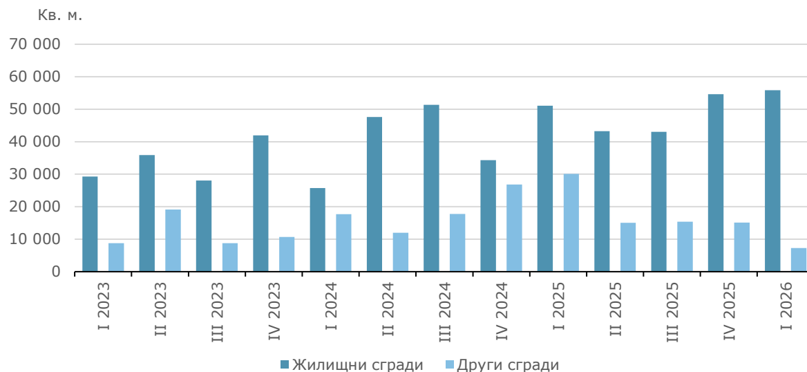
Фиг. 4. Започнато строителство на нови сгради - разгърната застроена площ по видове сгради и тримесечия