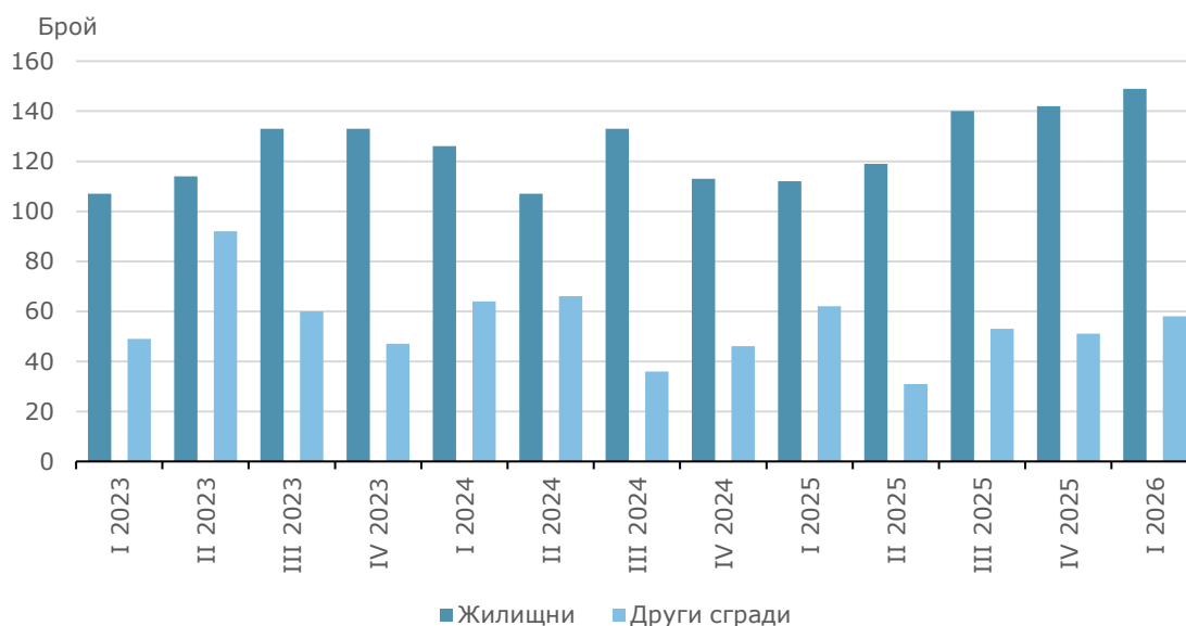
Фиг. 1. Издадени разрешителни за строеж на нови сгради по видове и тримесечия

В сравнение с първото тримесечие на 2025 г. при издадените разрешителни за строеж на нови жилищни сгради и броят на жилищата в тях се наблюдава увеличение съответно с 33.0 и 10.5%, а при разгънатата застроена площ с 11.8%. При издадените разрешителни за строеж на други видове сгради е регистрирано намаление с 6.5%, а при разгънатата им застроена площ се наблюдава увеличение със 155.7%.