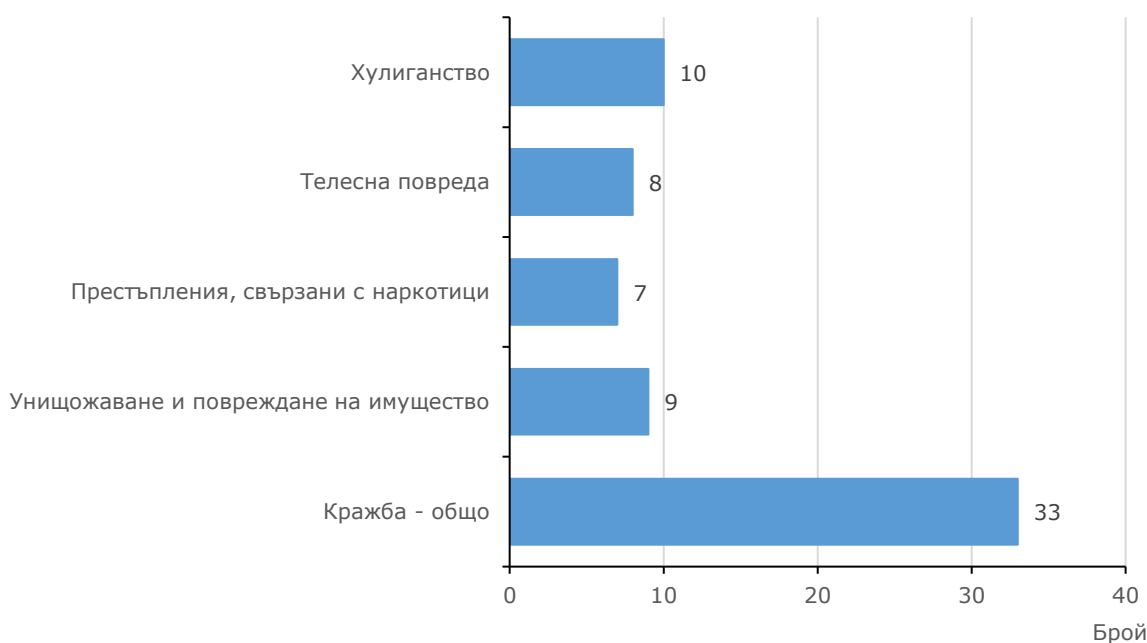
Фиг. 2. Малолетни и непълнолетни лица, преминали през ДПС, по някои видове престъпления през 2025 година

всички лица, преминали през ДПС за извършени престъпления. Най-висок е делът на извършителите на кражби на части и вещи от МПС- 39.4% (13 лица).