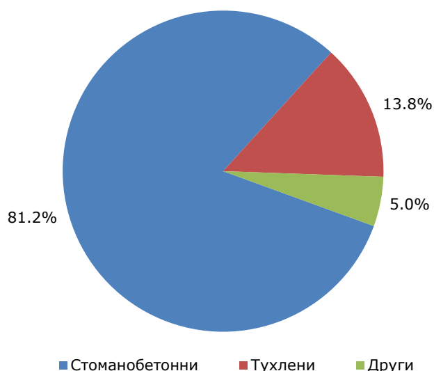
Фиг. 1. Въведени в експлоатация новопостроени жилищни сгради в област Варна през първото тримесечие на 2026 г. по конструкция

Област Варна е на второ място в страната по въведени в експлоатация жилищни сгради. Преди нея е област Пловдив - 171 сгради с 516 жилища, а след нея областите София (столица) - 158 сгради с 968 жилища, София - 123 сгради със 124 жилища и Бургас - 87 сгради с 672 жилища.