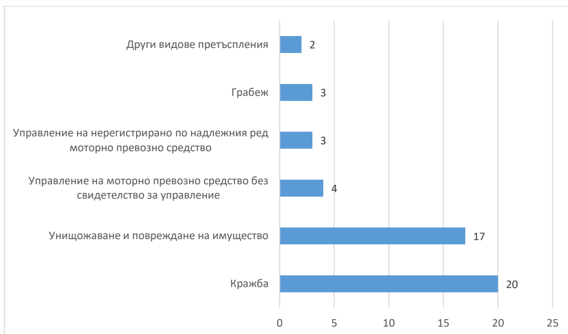
Фиг. 2. Някои видове престъпления, извършени от лица, водени на отчет в ДПС през 2025 година

Кражбите на имущество са най-разпространените престъпления, извършвани от малолетните и непълнолетните. Извършените кражби през отчетната година са 20, или 36.4% от всички извършени престъпления. Най-висок е делът на извършените домови кражби - 40.0% (8 лица).