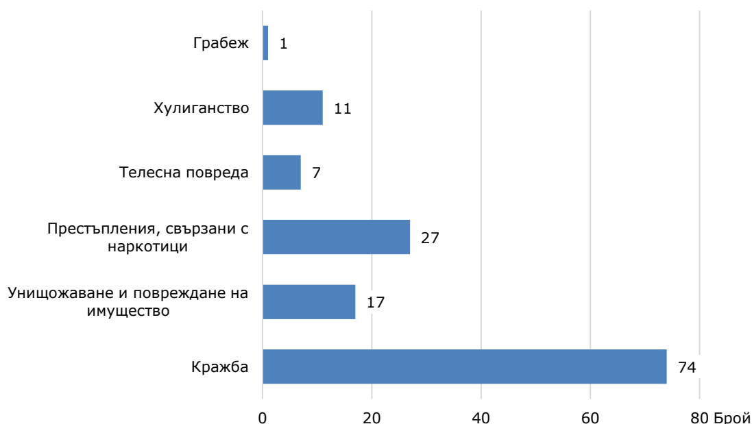
Фиг. 2. Някои видове престъпления, извършени от лица, водени на отчет в ДПС в област Бургас през 2025 година

Кражбите на имущество са най-разпространените престъпления, извършвани от лицата на възраст 8 - 17 години. Извършителите на кражби през отчетната година са 74 или 45.4% от всички извършени престъпления (виж фиг. 2). Най-висок е дялът на извършителите на кражби от магазини или други търговски обекти - 33.8% (25), следват кражбите от домове - 24.3% (18).