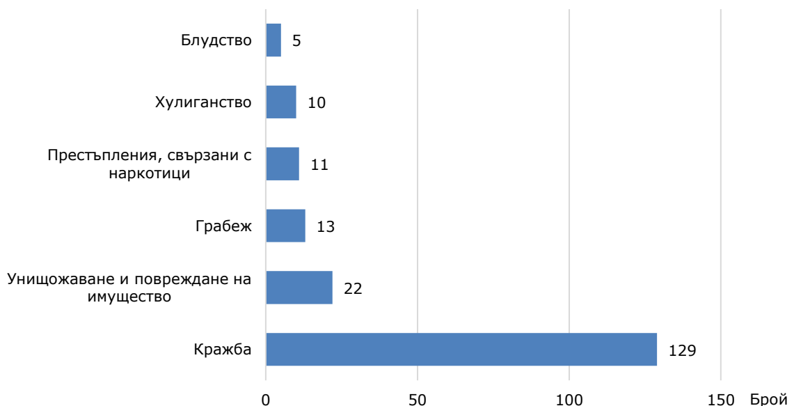
Фиг. 2 Някои видове престъпления, извършени от лица, водени на отчет в ДПС в област Стара Загора през 2025 година

Кражбите на имущество са най-разпространените престъпления, извършвани от лицата на възраст 8 - 17 години. Извършителите на кражби през отчетната година са 129 или 52.4% от всички извършени престъпления (виж фиг. 2). Най-висок е дялът на извършителите на други кражби - 44.2% (57), следват кражбите от магазини или други търговски обекти – 25.6% (33).