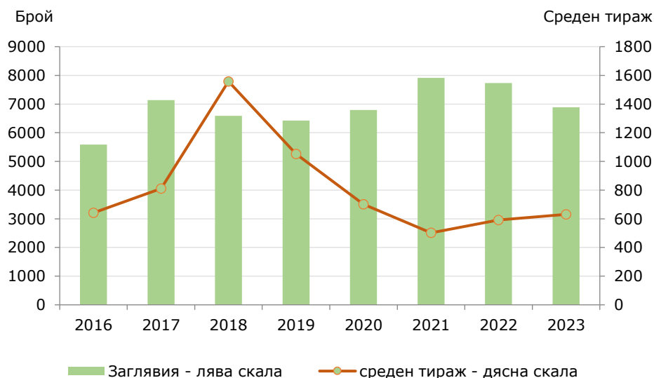
Фиг.1. Издадени книги и брошури и среден тираж 1 на една книга и брошура през периода 2016 – 2023 г. в област София (столица)

В сравнение с предходната година през 2023 г. броят на издадените книги и брошури намалява с 847 (10.9%), а средния тираж нараства от 592 през 2022 г. на 630 през 2023 г. или с 6.4%.