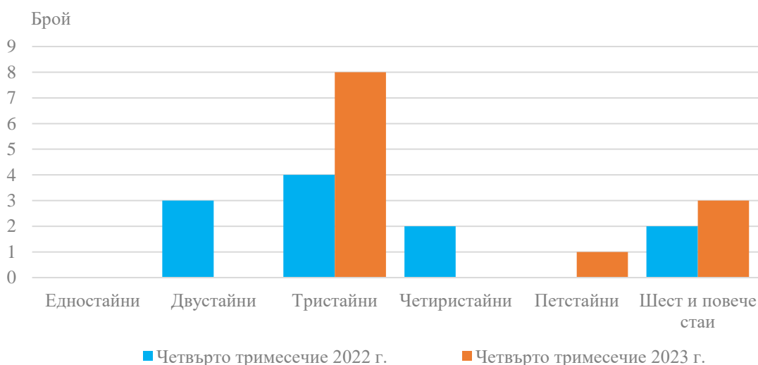
Фиг. 2. Въведени в експлоатация новопостроени жилища в област Кюстендил по брой на стаите

Общата полезна площ на всички новопостроени жилища в област Кюстендил през четвъртото тримесечие на 2023 г. е 1 658 кв. м, или с 64.8% по-голяма в сравнение със същото тримесечие на 2022 г., жилищната площ се увеличава с 27.9% и достига 957 кв. метра.