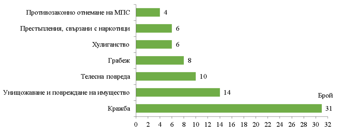
Фиг. 2. Малолетни и непълнолетни лица, преминали през ДПС, по някои видове престъпления през 2023 година

Най-разпространеното престъпление, извършвано от малолетните и непълнолетните в област Шумен, е кражба. Извършители на това престъпление са 31 лица, или 37.3% от всички, преминали през ДПС за извършени престъпления.