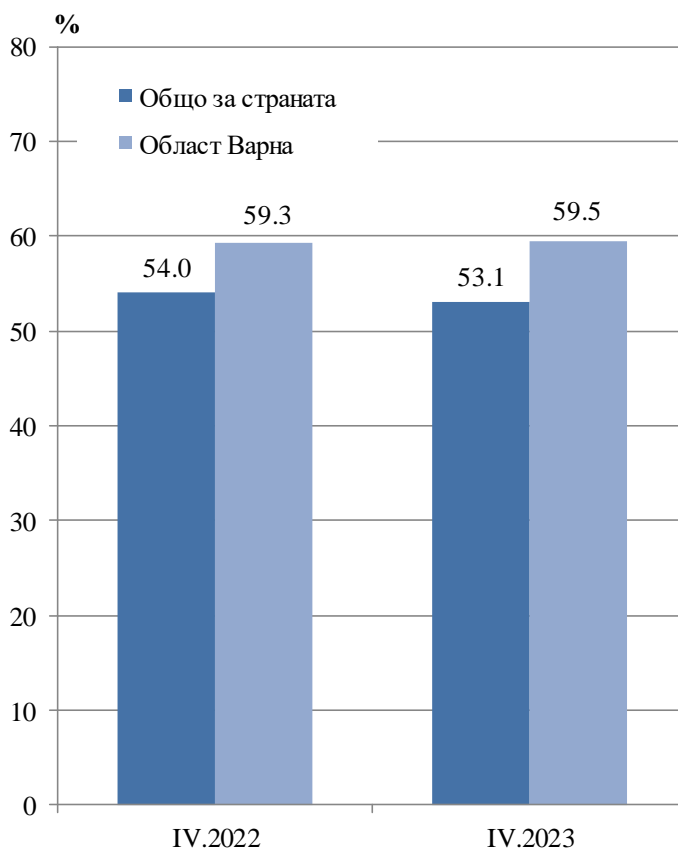
Фиг. 1. Коефициент на заетост през четвъртото тримесечие на 2022 и 2023 година

По брой на заетите лица област Варна е на трето място в страната след област София (столица) и област Пловдив, а по коефициент на заетост е на второ място след област София (столица).