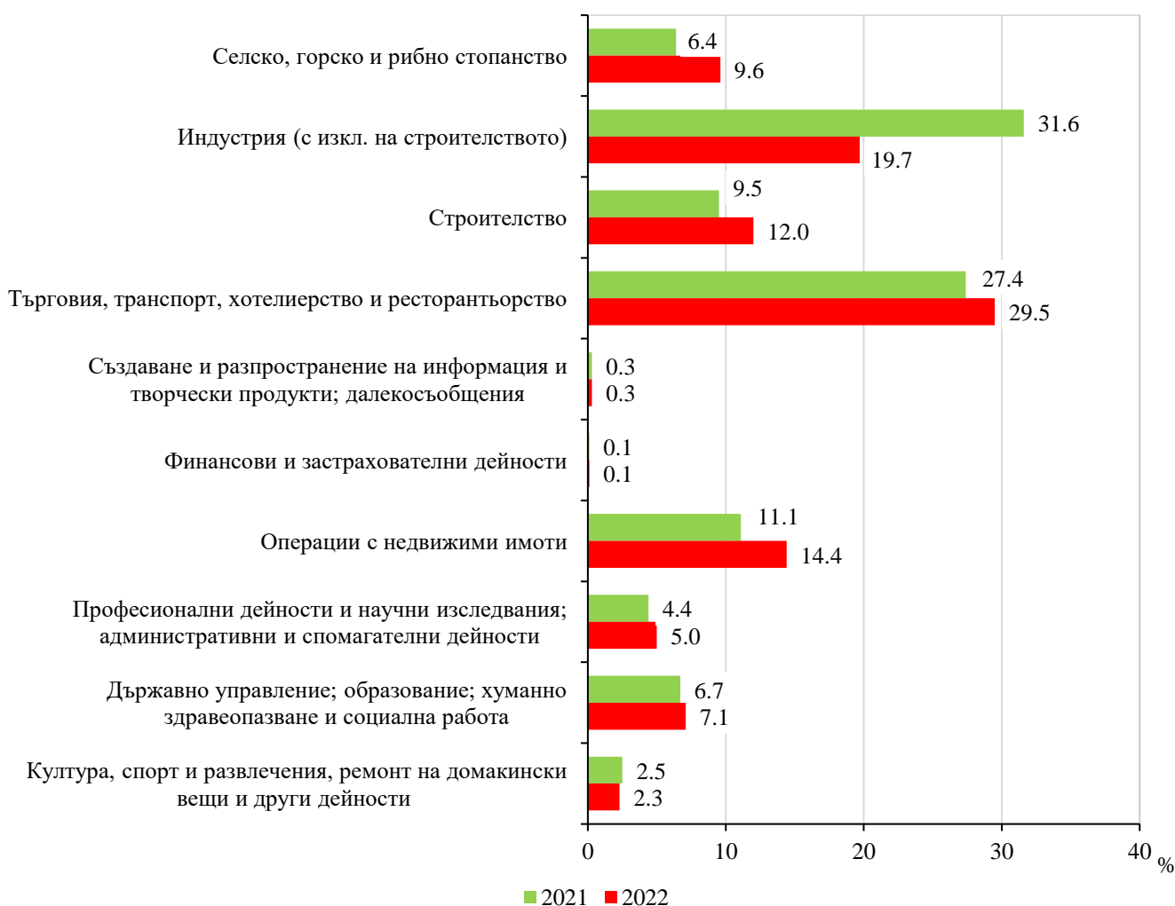
Фиг. 1. Структура на разходите за придобиване на дълготрайни материални активи по икономически дейности в област Бургас през 2021 и 2022 година

През 2022 г. в структурата на разходите за придобиване на ДМА по икономически дейности се наблюдава нарастване на направените инвестиции в сектора на операциите с недвижими имоти, като относителният им дял се увеличава с 3.3 процентни пункта в сравнение с 2021 г., и спад в сектора на индустрията (с изкл. на строителството) с 11.9 процентни пункта.