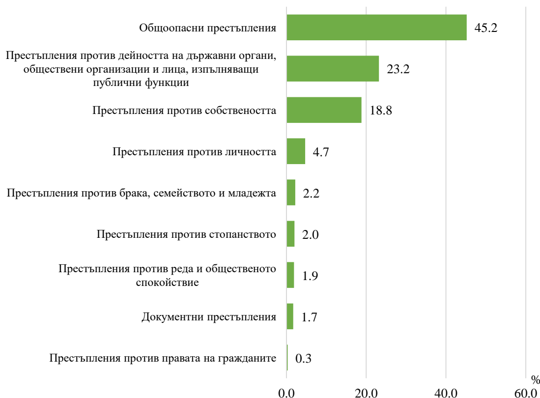
Фиг. 3. Структура на осъдените лица през 2022 г. по глави от НК

За извършването на общопасни престъпления са наказани 290, или 45.2%. На второ място в структурата на осъдените за престъпления против дейността на държавни органи, обществени организации и лица, изпълняващи публични функции - 149 лица (23.2%).