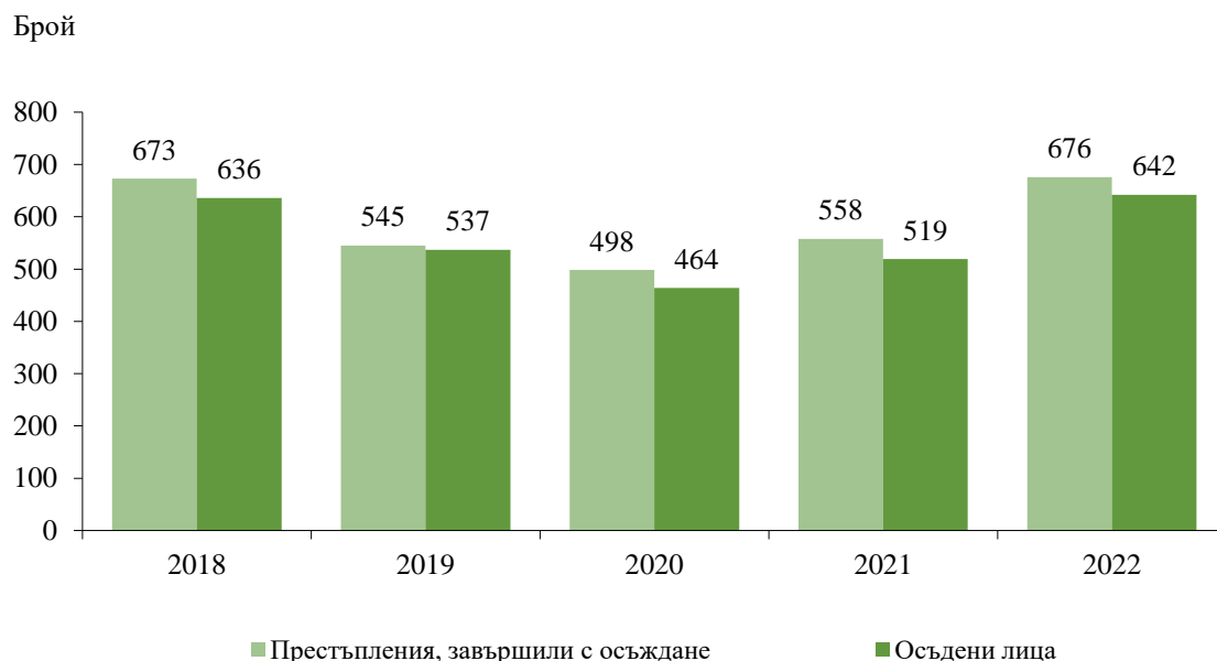
Фиг. 1. Престъпления, завършили с осъждане, и осъдени лица в област Кюстендил през периода 2018 - 2022 година

Осъдените непълнолетни лица (14 - 17 години) са 33, или 5.1% от всички осъдени.