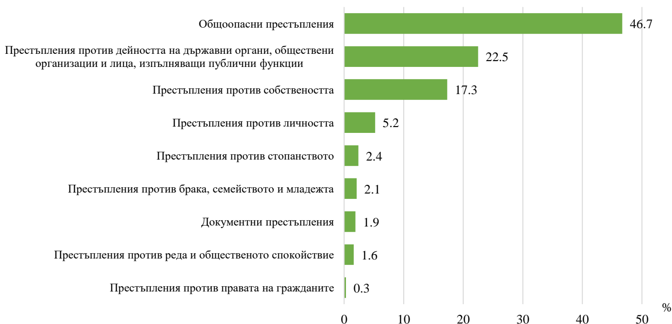
Фиг. 2. Структура на престъпленията, завършили с осъждане в област Кюстендил през 2022 г. по глави от НК

С осъждане са завършили 117 престъпления против собствеността , което представлява 17.3% от всички наказани престъпления. Броят на тези престъпления се повишава в сравнение с 2021 г. - с 19.4%.