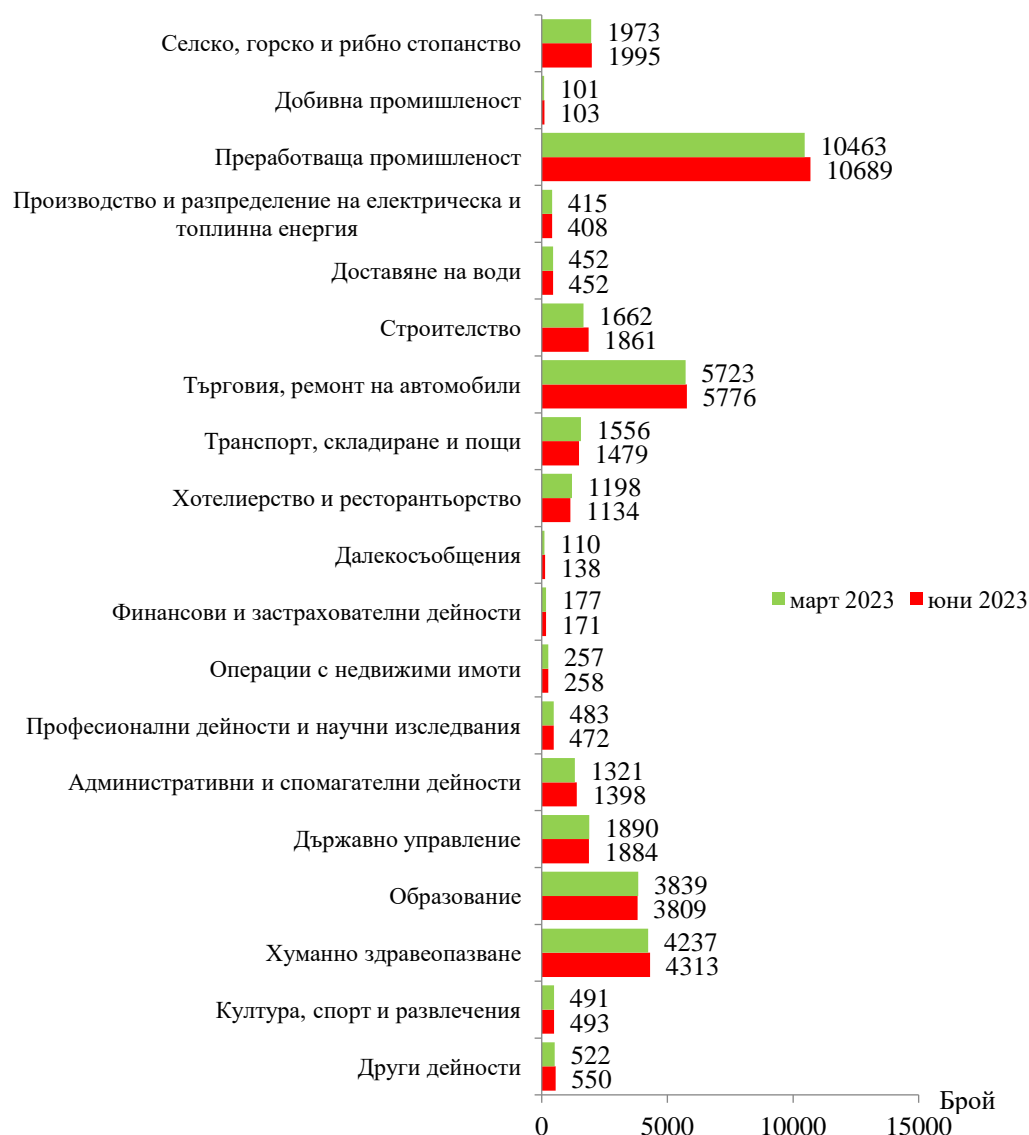
Фиг. 1. Наети лица по трудово и служебно правоотношение в област Сливен към края на март 2023 и юни 2023 година

Спрямо края на първото тримесечие на 2023 г. наетите лица в общественния сектор се увеличават с 0.4% (достигат до 11.5 хил.), а в частния сектор - с 1.8% (достигат до 25.9 хил.).