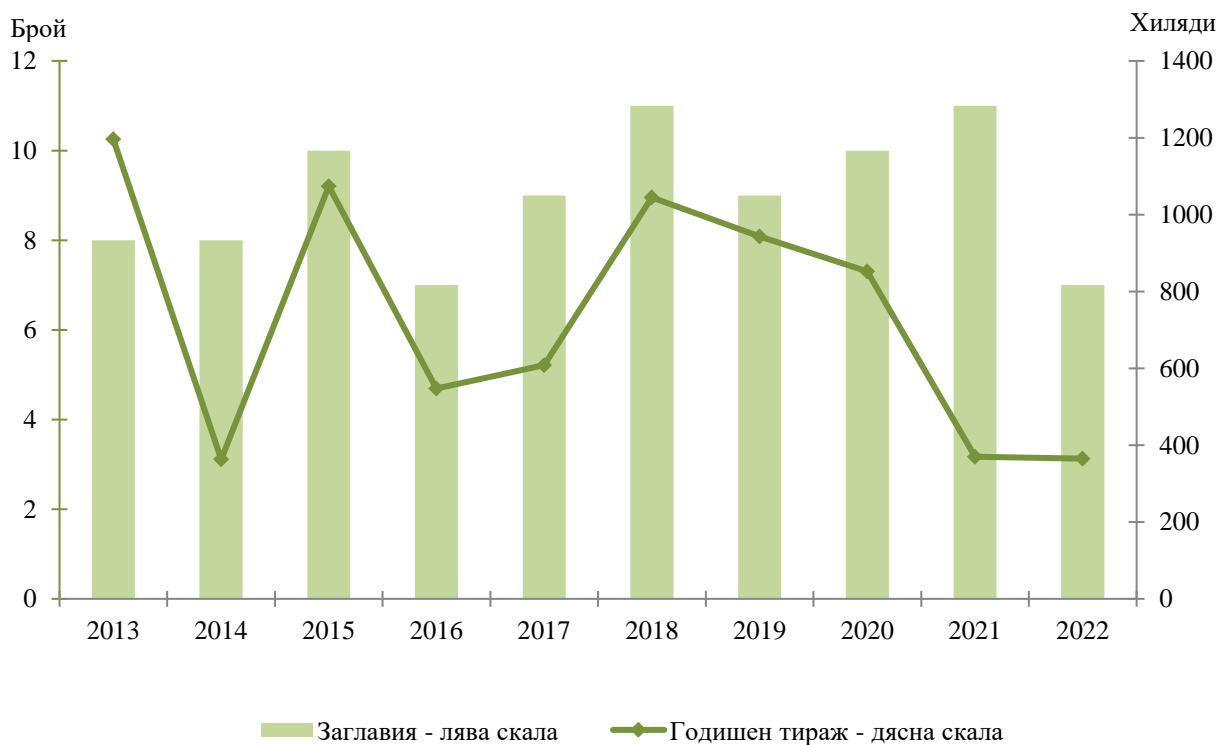
Фиг. 2. Издавани вестници в област Стара Загора по заглавия и годишен тираж през периода 2013 - 2022 година

Относителният дял на издаваните вестници в област Стара Загора е 7.0% спрямо регионалните вестници общо за страната, а годишният тираж - 3.3% от тиража на всички регионални вестници.