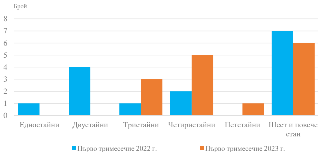
Фиг. 2. Въведени в експлоатация новопостроени жилища в област Кюстендил по брой на стаите

Общата полезна площ на всички новопостроени жилища в област Кюстендил през първото тримесечие на 2023 г. е 2 297 кв. м, или с 25.9% повече в сравнение със същото тримесечие на 2022 г., а жилищната площ се увеличава с 25.0% и достига 1 722 кв. метра.