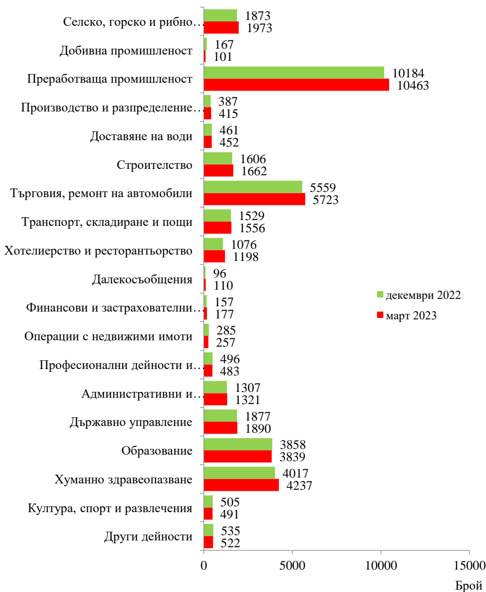
Фиг. 1. Наети лица по трудово и служебно правоотношение в област Сливен към края на декември 2022 и март 2023 година

Спрямо края на четвъртото тримесечие на 2022 г. наетите лица в общественения сектор се увеличават с 3.1% (достигат до 11.5 хил.), а в частния сектор - с 2.2% (достигат до 25.4 хил.).