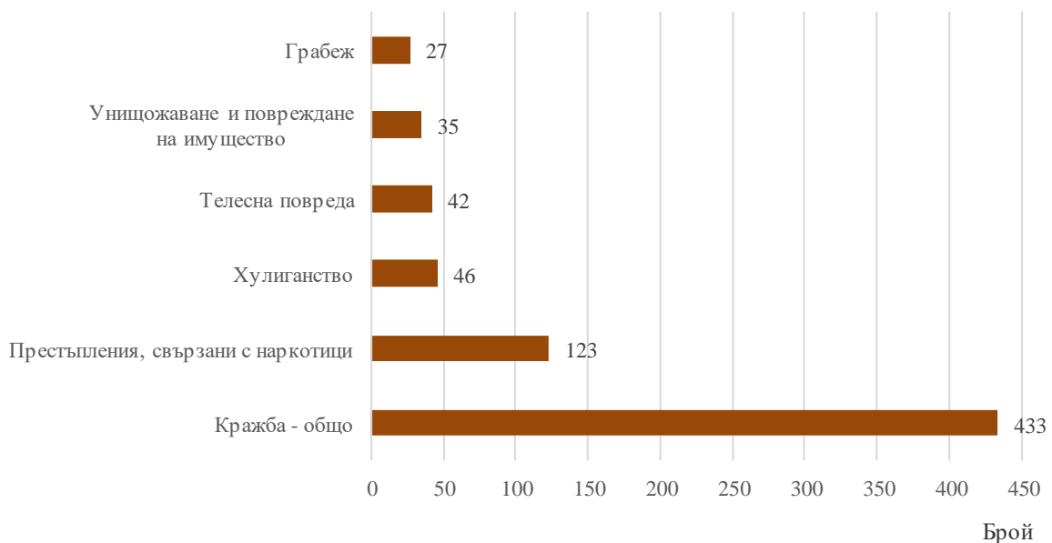
Фиг.2. Малолетни и непълнолетни лица, преминали през ДПС, по някои видове престъпления през 2022 година