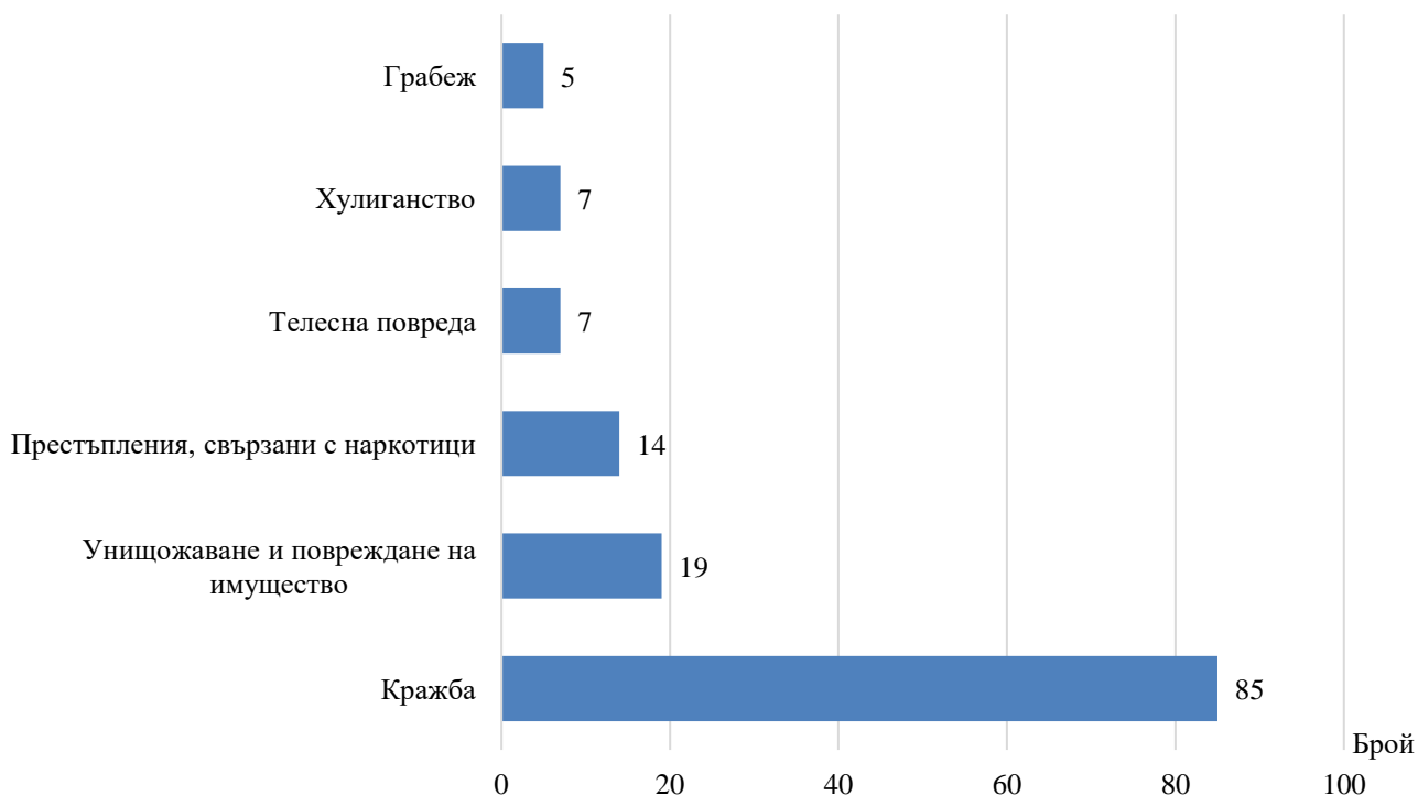
Фиг. 2 Малолетни и непълнолетни лица, преминали през ДПС, по някои видове престъпления през 2022 година в област Бургас

Кражбите на имущество са най-разпространените престъпления, извършвани от лицата на възраст 8 - 17 години. Извършителите на кражби са 85 или 57.8% от всички малолетни и непълнолетни преминали през ДПС за извършени престъпления. Най-висок е дялът на извършителите на кражби от домове - 32.9% (28 лица), следват кражби от магазини или други търговски обекти - 31.8% (27 лица), и кражби на селскостопанска продукция, домашни животни и птици - 17.6% (15 лица).