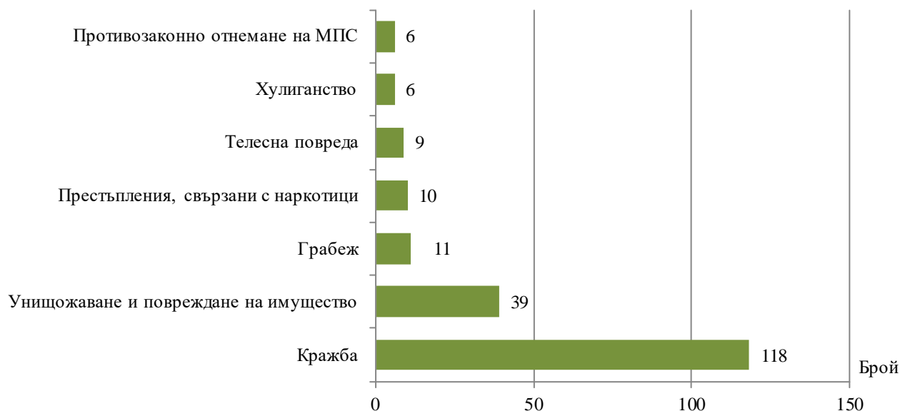
Фиг. 2. Малолетни и непълнолетни лица, преминали през ДПС в област Благоевград, по някои видове престъпления през 2022 година