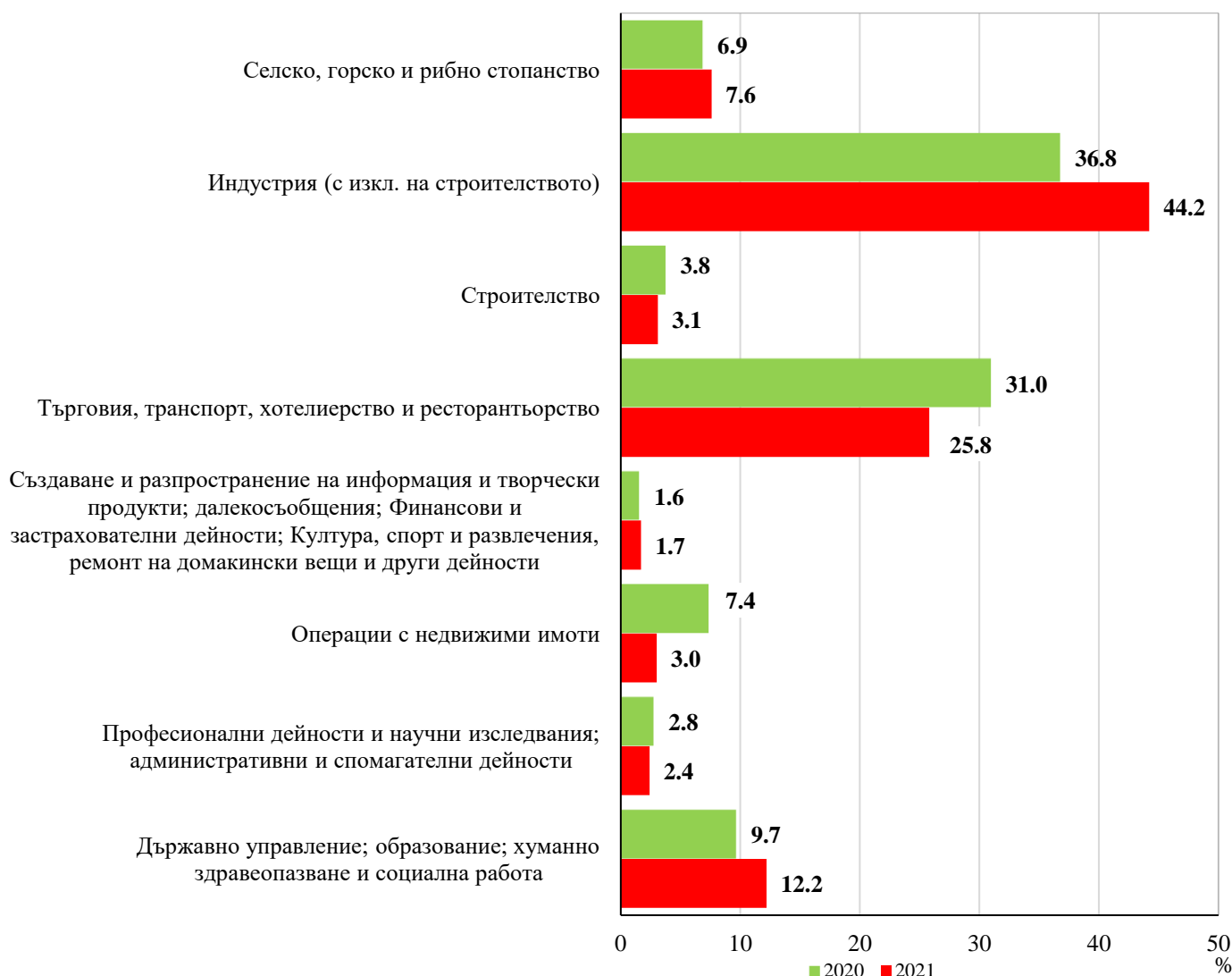
Фиг. 1. Структура на разходите за придобиване на дълготрайни материални активи през 2020 и 2021 г. в област Кюстендил по икономически дейности

През 2021 г. разходите за придобиване на дълготрайни материални активи (ДМА) във всички сектори на икономиката в област Кюстендил са 137.4 млн. лв. по текущи цени, което е с 46.0% повече в сравнение с предходната година.