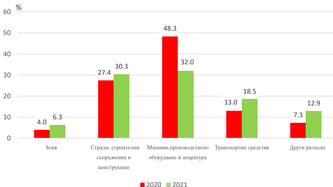
Фиг. 2. Структура на разходите за придобиване на дълготрайни материални активи по видове в област Враца през 2020 и 2021 година

Най-значителни разходи за придобиване на дълготрайни материални активи са извършени в община Враца - 127.1 млн. лв., или 45.7% от общите разходи за областта. Следва община Мездра с 14.9%.