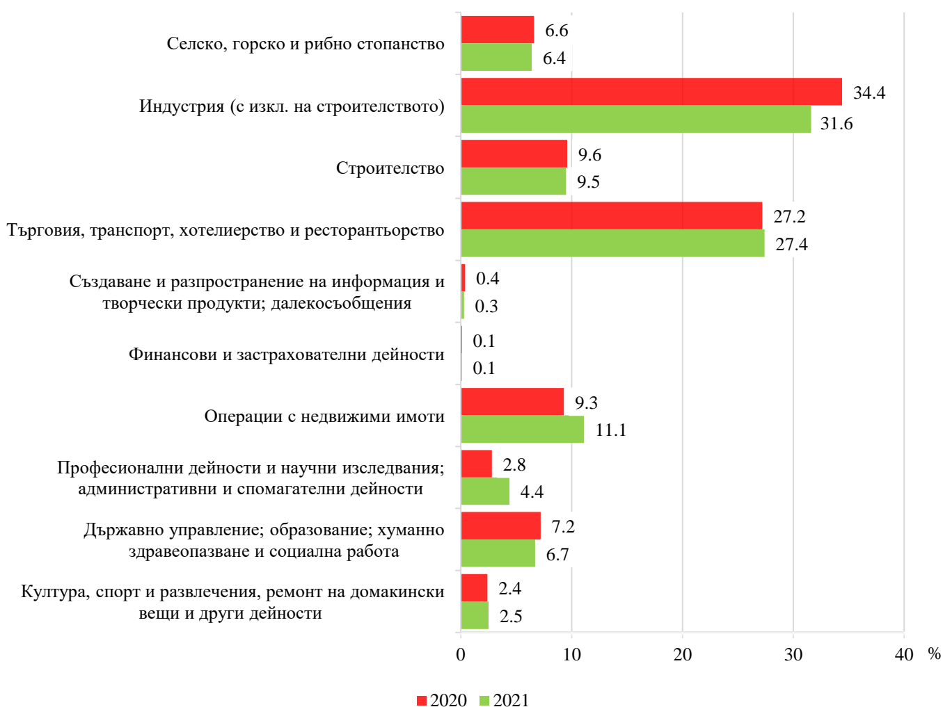
Фиг. 1. Структура на разходите за придобиване на дълготрайни материални активи по икономически дейности в област Бургас през 2020 и 2021 година

През 2021 г. в структурата на разходите за придобиване на ДМА по икономически дейности се наблюдава нарастване на направените инвестиции в сектора на операциите с недвижими имоти, като относителният им дял се увеличава с 1.8 процентни пункта в сравнение с 2020 г., и спад в сектора на индустрията (с изкл. на строителството) с 2.8 процентни пункта.