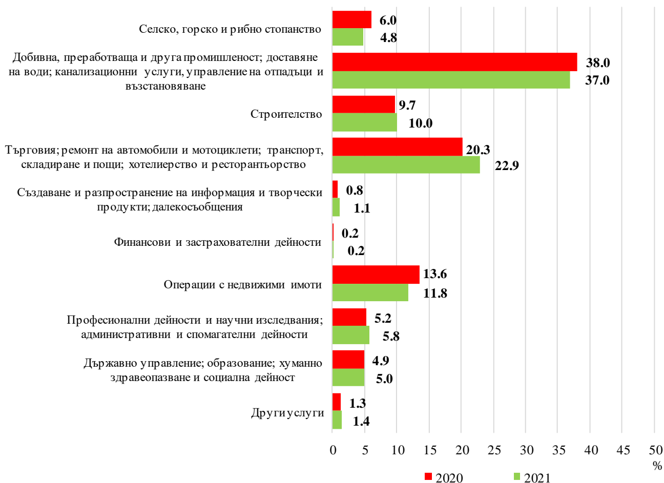
Фиг. 2. Структура на разходите за придобиване на дълготрайни материални активи през 2020 и 2021 г. по икономически дейности

Най-голям обем инвестиции в ДМА са вложени в промишления сектор - 830 млн. лв., и в сектора на услугите (търговия, ремонт на автомобили и мотоциклети, транспорт, складиране и пощи, хотелиерство и ресторантьорство) - 515 млн. лева. През 2021 г. тези сектори заедно формират 59.9% от общия обем разходи за ДМА, а относителният им дял общо нараства с 1.6 пункта спрямо предходната година. В сектор „Операции с недвижими имоти” инвестициите в ДМА достигат 266 млн. лева, или с 14.9% повече в сравнение с 2020 година.