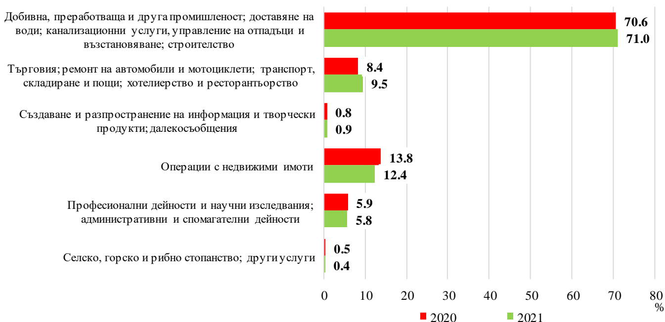
Фиг. 1. Структура на преките чуждестранни инвестиции в предприятията от нефинансовия сектор по икономически дейности към 31.12.

С най-голям размер на ПЧИ е община Пловдив - 66.2% от общия обем, следвана от Марица и Раковски - съответно 12.1% и 5.4%.