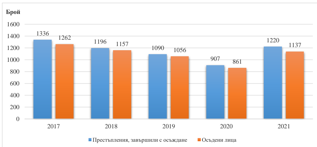
Фиг.1. Престъпления, завършили с осъждане, и осъдени лица в област Плевен през периода 2017 - 2021 година

През 2021 г. броят на осъдените лица с влезли в сила присъди в област Плевен е 1 137.