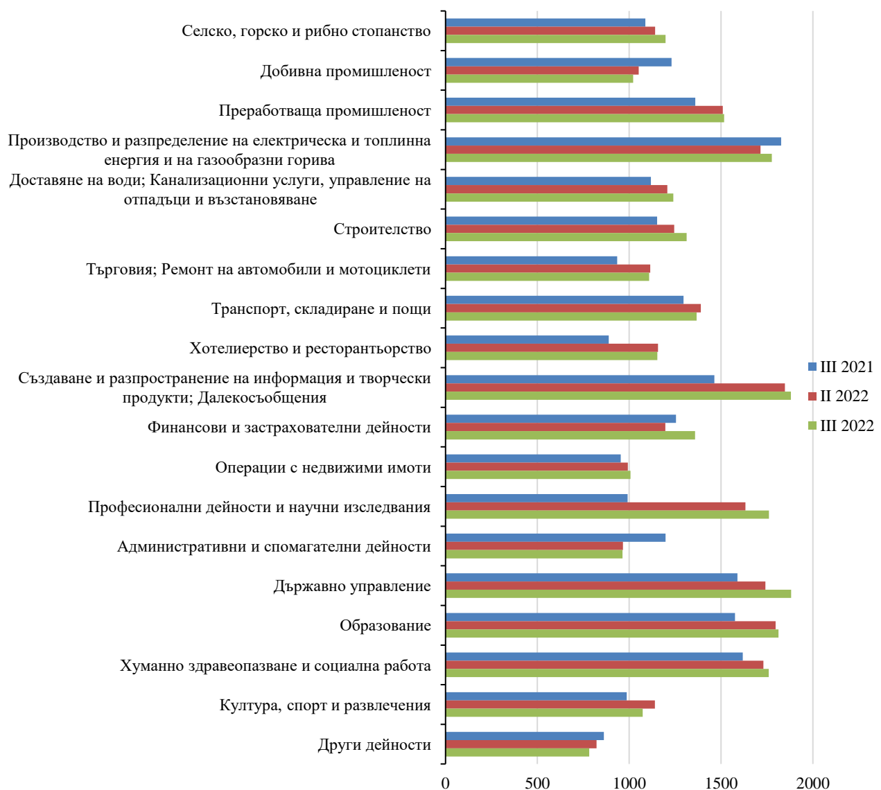
Фиг. 3. Средна брутна месечна работна заплата по икономически сектори в област Бургас - левове

Спрямо същия период на предходната година средната месечна работна заплата през третото тримесечие на 2022 г. нараства с 14.7%, в общественения сектор нарастването е с 13.2%, а в частния сектор - с 15.2%.