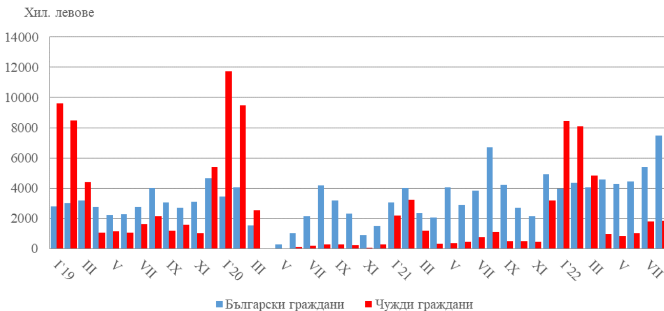
Фиг. 2. Приходи от нощувки в местата за настаняване в област Благоевград по месеци

Приходите от нощувки през август 2022 г. достигат 9 296.7 хил. лв., или с 19.5% повече в сравнение с август 2021 година. Регистрирано е увеличение на приходите както от чужди граждани - с 68.9%, така и от български граждани - с 11.5% (фиг. 2).