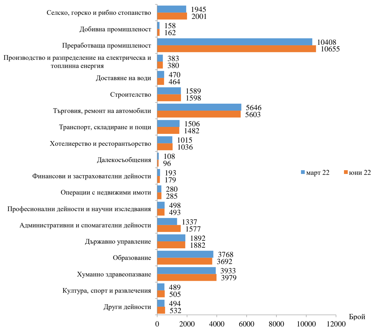
Фиг. 1. Наети лица по трудово и служебно правоотношение в област Сливен към края на март и юни 2022 година

Спрямо края на първото тримесечие на 2022 г. наетите лица в общественния сектор се увеличават с 2.2% (достигат до 11.2 хил.), а в частния сектор - с 1.0% (достигат до 25.4 хил.).