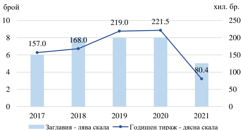
Фиг. 2. Издадени вестници в Софийска област през периода 2017 - 2021 година

През 2021 г. в Софийска област са издавани 5 вестника с годишен тираж 80.4 хил. броя. Броят на издадените вестници през 2021 г. е намалял с 37.5% спрямо 2020 година (фиг. 2).