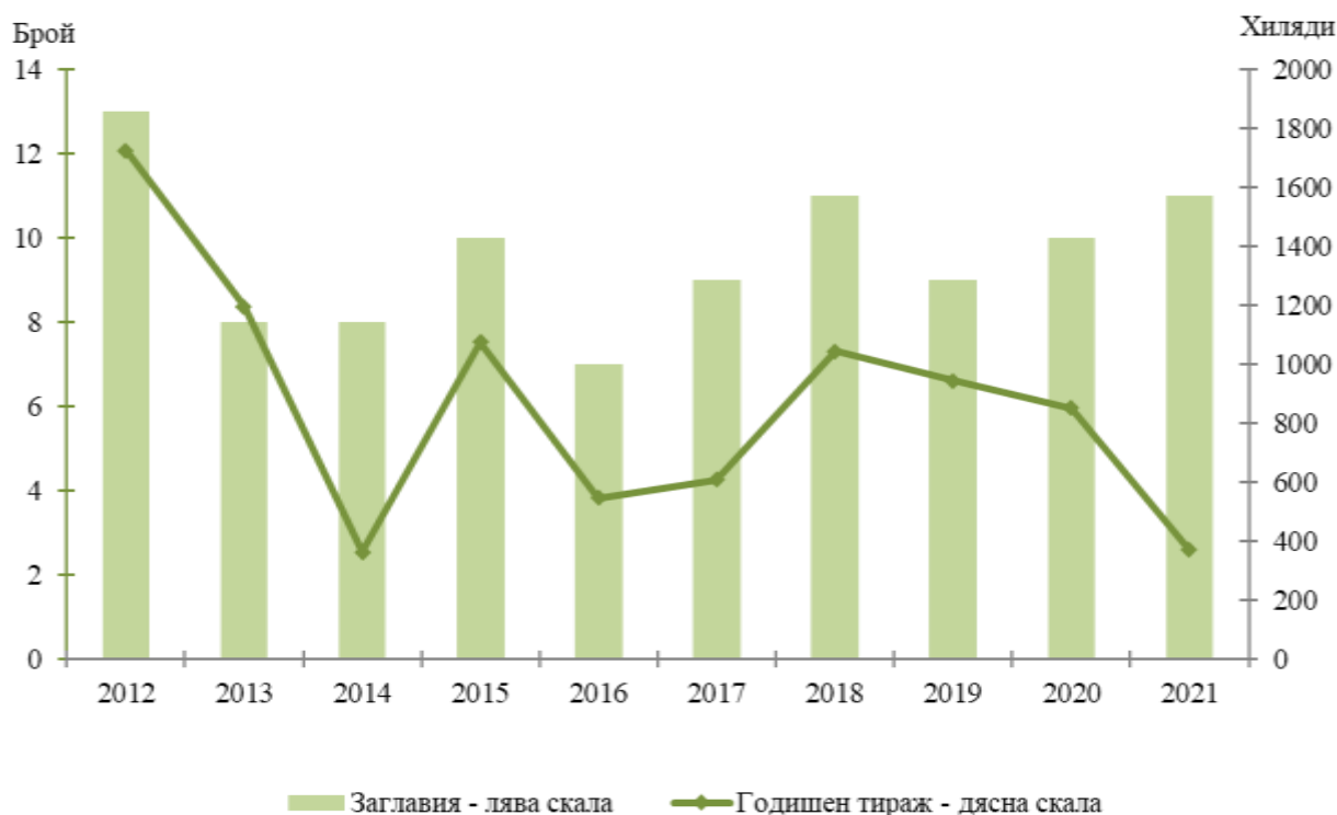
Фиг. 2. Издавани вестници в област Стара Загора по заглавия и годишен тираж през периода 2012 - 2021 година

Относителният дял на издаваните вестници в област Стара Загора е 10.4% спрямо регионалните вестници общо за страната, а годишният тираж - 3.4% от тиража на всички регионални вестници.