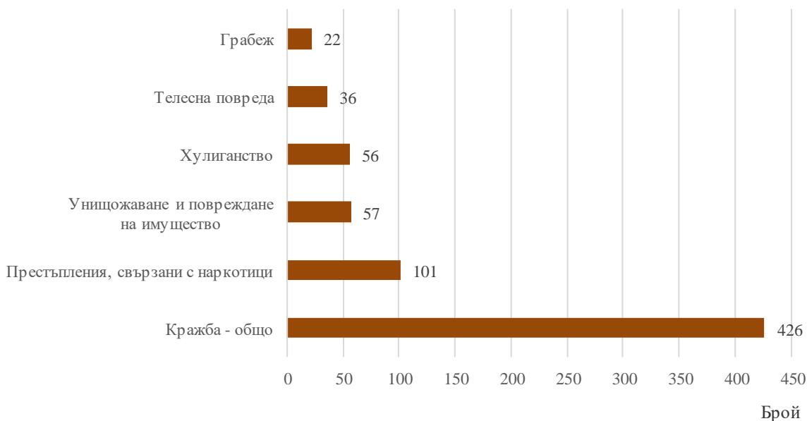
Фиг.2. Малолетни и непълнолетни лица, преминали през ДПС, по някои видове престъпления през 2021 година