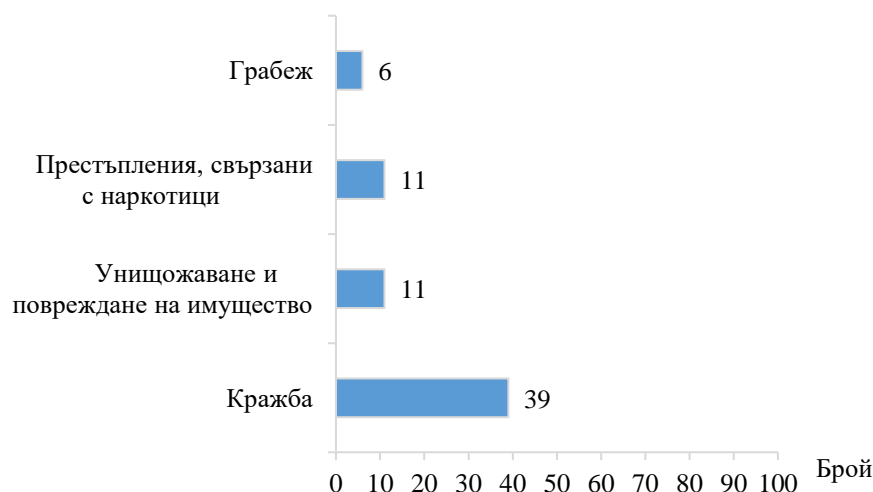
Фиг. 2. Малолетни и непълнолетни лица, преминали през ДПС, по някои видове престъпления в Софийска област през 2021 година

Кражбите на имущество са най-разпространените престъпления, извършвани от лицата на възраст 8 - 17 години. Извършители на кражби са 39 лица, или 50.0% от всички лица, преминали през ДПС за извършени престъпления. Най-висок е дялът на извършителите на кражби от домовете - 33.3% (13 лица).