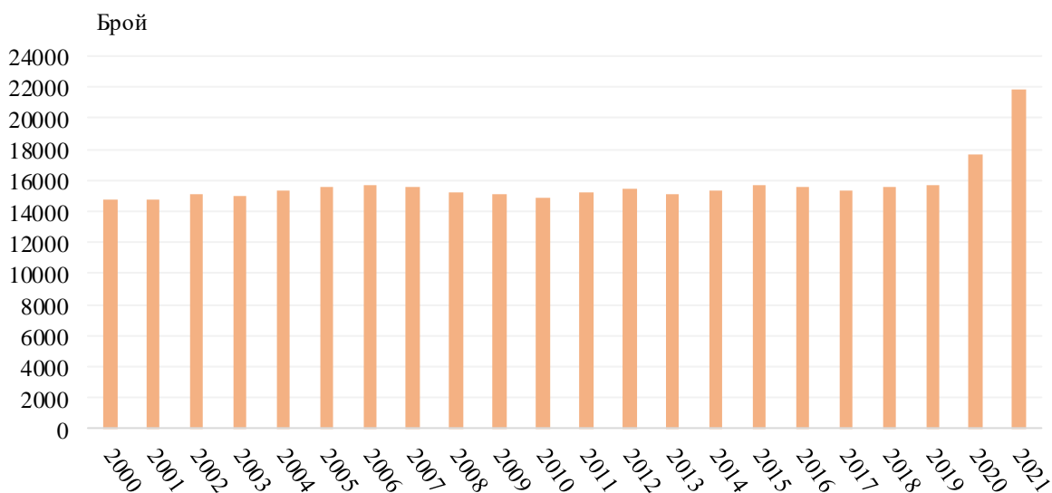
Фиг. 2. Умрели в област София (столица) през периода 2000 - 2021 година

Броят на умрелите лица в област София (столица) през 2021 г. е 21 910, а коефициентът на обща смъртност 4 - 16.8‰, при 21.7‰ общо за страната. Спрямо предходната година броя на умрелите в областта нараства с 4 189, или с 23.6%. Нивото на общата смъртност продължава да е твърде високо.