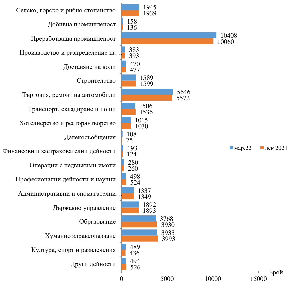
Фиг. 1. Наети лица по трудово и служебно правоотношение в област Сливен към края на декември 2021 и март 2022 година

Спрямо края на четвъртото тримесечие на 2021 г. наетите лица в общественения сектор намаляват с 2.6% (достигат до 11.0 хил.), а в частния сектор се увеличават с 2.3% (достигат до 25.1 хил.).