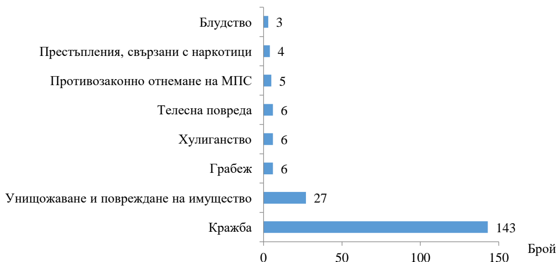
Фиг. 2. Малолетни и непълнолетни, преминали през ДПС, по някои видове престъпления през 2021 година

Пострадалите от престъпления малолетни и непълнолетни лица през 2021 г. са 69, от които 48, или 69.6% са момичета. Относителният дял на малолетните, пострадали от престъпления, е 49.3% (34 лица), а на непълнолетните - 50.7%, или 35 лица. Най-голям е броят и дялът на пострадалите от блудство - 8 лица (11.6%) и от нанесени телесни повреди - 7 лица (10.1%).