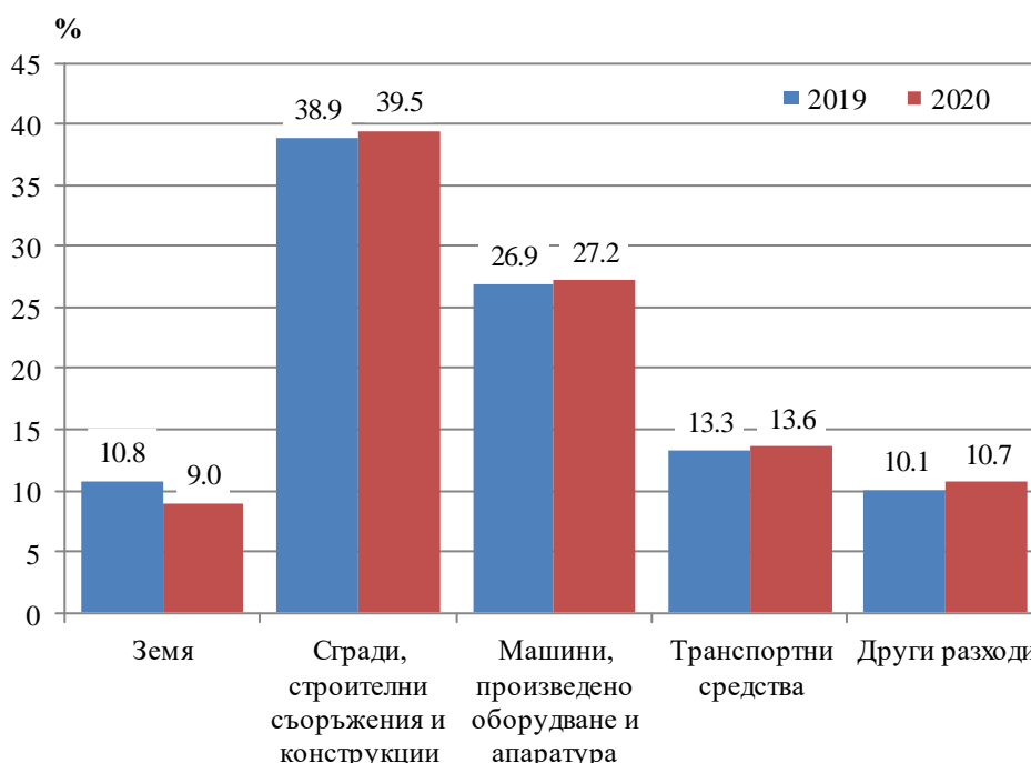
Фиг. 2. Структура на разходите за придобиване на дълготрайни материални активи през 2019 и 2020 г. по видове

През 2020 г. в структурата на разходите за придобиване на дълготрайни материални активи по видове се наблюдава нарастване на относителния дял на направените инвестиции в сгради, строителни съоръжения и конструкции с 0.6 процентни пункта в сравнение с предходната година, като делът им достига 39.5%. Увеличава се и относителният дял на вложените средства в други разходи с 0.6 процентни пункта, в разходи за машини, произведено оборудване и апаратура с 0.3 процентни пункта и в транспортни средства с 0.3 процентни пункта. Намалява само относителният дял на направените инвестиции за закупуване на земя с 1.8 процентни пункта в сравнение с 2019 година.