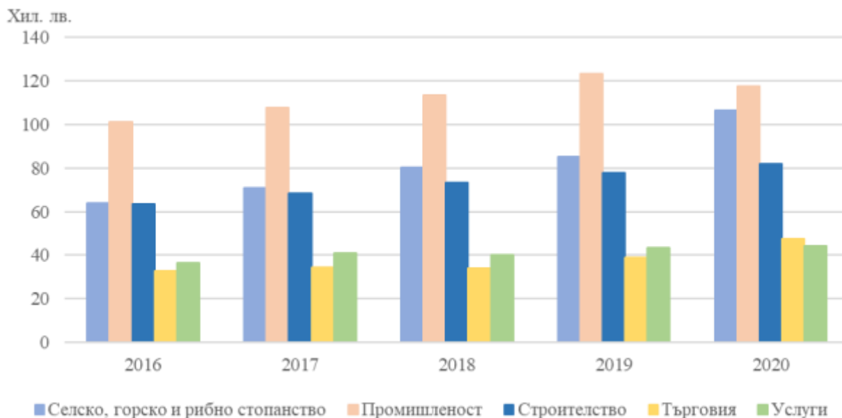
Фиг. 2. Произведена продукция на един зает по икономически сектори и по години

Нетните приходи от продажби в област Стара Загора са 10 394 млн. лв., като е отчетено намаление от 4.0% в сравнение с предходната година. Промислените предприятия са реализирали най-голям дял от нетните приходи - 50.8%.