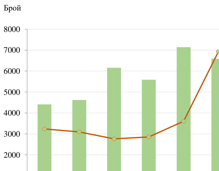
Фиг.1. Издадени книги и брошури и среден тираж 1 на една книга и брошура в област София (столица) през периода 2013 – 2020 година.

През 2020 г. в област София (столица) са издадени 99 вестника с годишен тираж 110 529 хиляди, като спрямо предходната година издадените вестници намаляват с 9 (8.3%), а тиражът намалява с 43 933 хил. (28.4%).