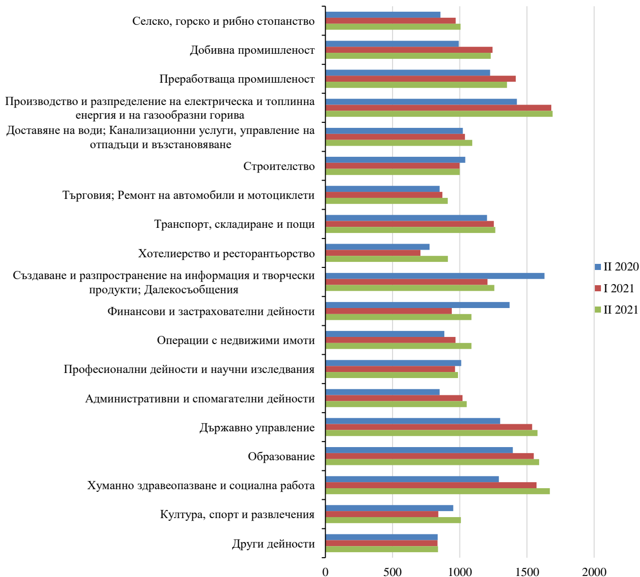
Фиг. 3. Средна брутна месечна работна заплата по икономически сектори в област Бургас – левове

Спрямо същия период на предходната година средната месечна работна заплата през второто тримесечие на 2020 г. в общественения сектор нараства с 16.5%, а в частния сектор - със 7.3%.