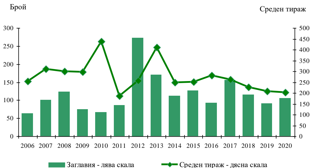
Фиг. 1. Издадени заглавия книги и брошури и среден тираж 1 на една книга и брошура в област Благоевград през периода 2006 - 2020 година

В сравнение с предходната година през 2020 г. броят на издадените в областта книги и брошури се увеличава с 15 (16.5%), а средният им тираж намалява - с 2.9% и достига 203 броя.