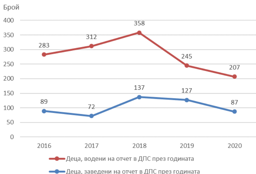
Фиг. 1. Малолетни и непълнолетни лица, водени и заведени на отчет в ДПС в област Враца през периода 2016 - 2020 година

През 2020 г. в област Враца броят на водените на отчет в ДПС 1 малолетни и непълнолетни лица е 207. Броят на малолетните и непълнолетните, заведени на отчет 2 в ДПС през годината в областта е 87.