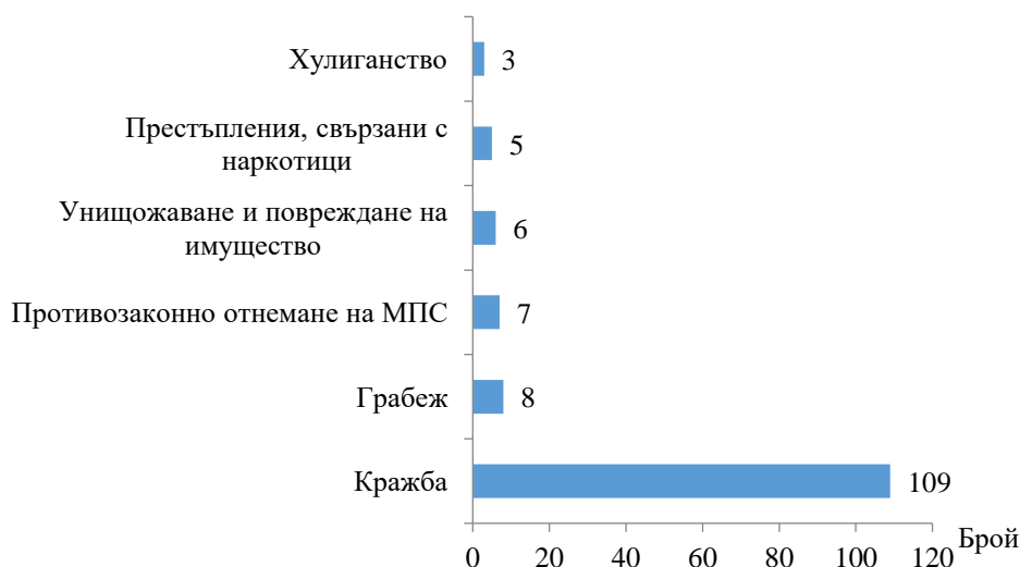
Фиг. 2. Малолетни и непълнолетни, преминали през ДПС, по някои видове престъпления през 2020 година

Пострадалите от престъпления малолетни и непълнолетни лица през 2020 г. са 58, от които 41, или 70.7% са момичета. Относителният дял на малолетните, пострадали от престъпления, е 39.7% (23 лица), а на непълнолетните - 60.3%, или 35 лица. Най-голям е броят и дялът на пострадалите от кражби - 7 лица (12.1%), от нанесени телесни повреди и блудство - по 4 лица (6.9%).