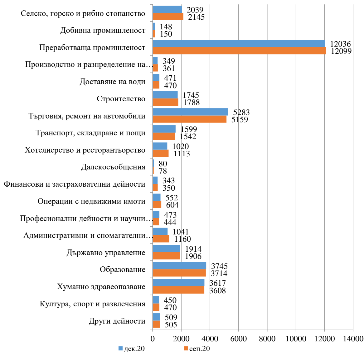
Фиг. 1. Наети лица по трудово и служебно правоотношение в област Сливен към края на септември 2020 и декември 2020 година

Спрямо края на третото тримесечие на 2020 г. наетите лица в общественения сектор намаляват с 1.4% (достигат до 10.8 хил.), а в частния сектор са по-малко с 0.4% (достигат до 26.6 хил.).