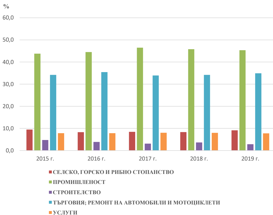
Фиг. 2. Структура на нетните приходи от продажби по икономически сектори и по години

Реализираните нетни приходи от продажби в област Монтана през 2019 година са 2 706 млн. лв., което е с 10.0% повече спрямо предходната година. Най-голямо е увеличението в секторите „Добивна промишленост“ (35.2%) и „Селско, горско и рибно стопанство“ (20.7%), а спад е отчетен в секторите „Професионални дейности и научни изследвания“ (25.3%) и „Строителство“ (14.5%).