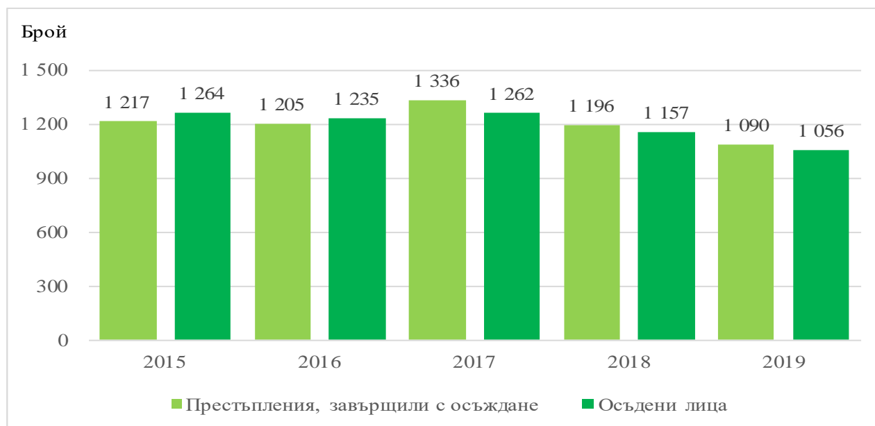
Фиг.1. Престъпления, завършили с осъждане, и осъдени лица в област Плевен през периода 2015 – 2019 година

През 2019 г. броят на осъдените лица с влезли в сила присъди в област Плевен е 1 056. В сравнение с 2018 г. се наблюдава намаление с 8.7%.