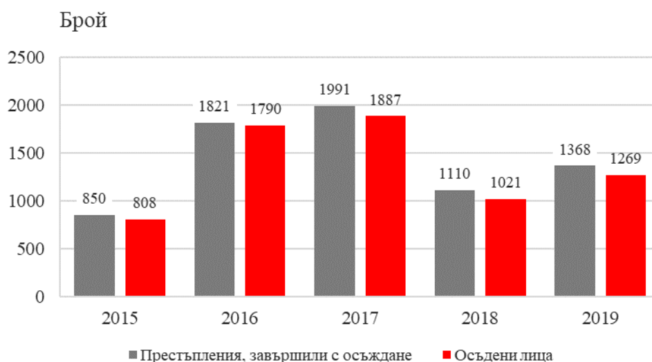
Фиг. 1. Престъпления, завършили с осъждане, и осъдени лица в София (столица) през периода 2015 - 2019 година