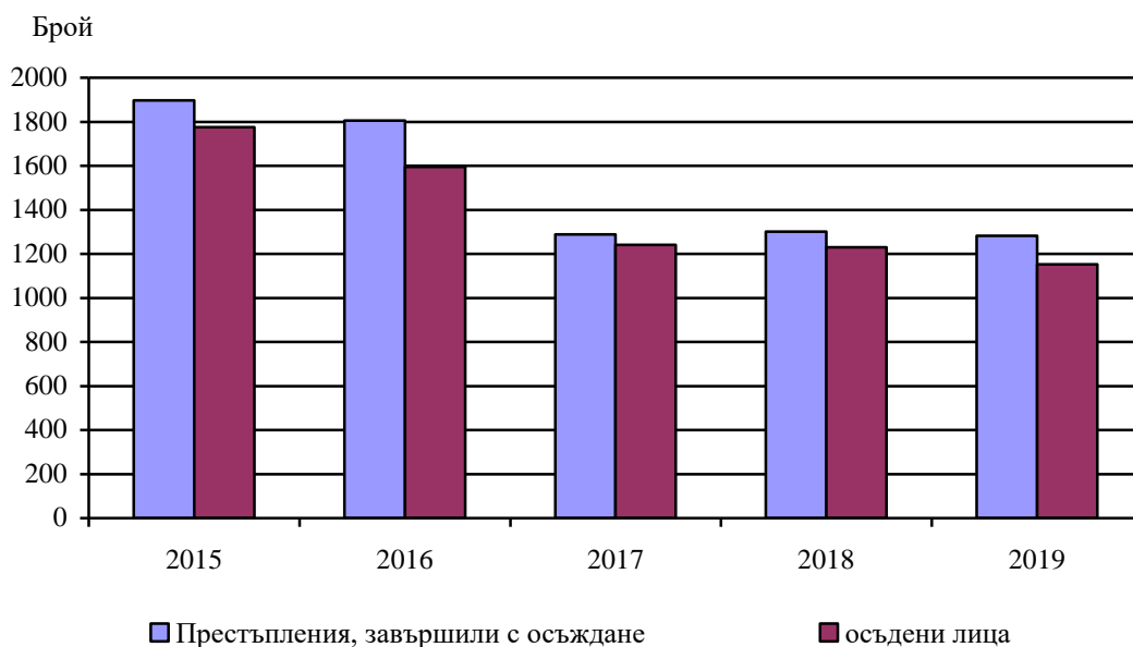
Фиг. 1. Престъпления, завършили с осъждане, и осъдени лица в област Благоевград през периода 2015 - 2019 година