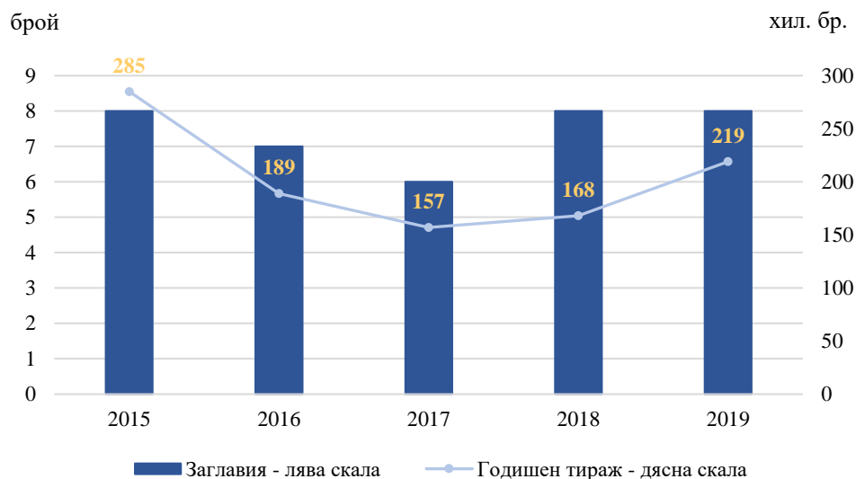
Фиг. 2. Издадени вестници в Софийска област през периода 2015 - 2019 година