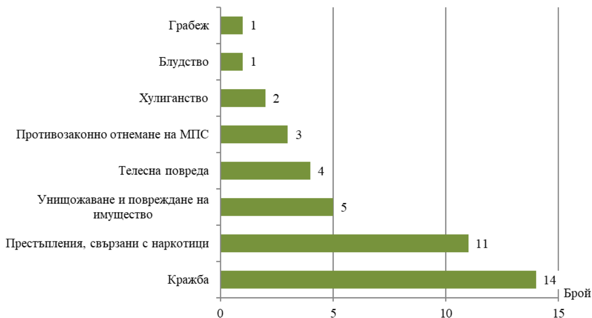
Фиг. 2. Малолетни и непълнолетни, извършители на престъпления, по някои видове престъпления в област Кюстендил през 2019 година

17.5% от лицата на възраст от 8 до 17 години са извършили престъпления, свързани с наркотици (Фиг. 2).