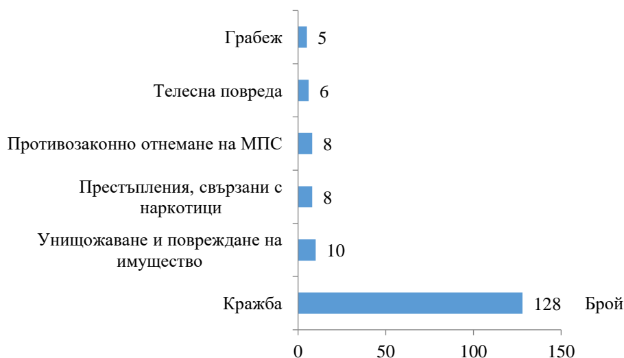
Фиг. 2. Малолетни и непълнолетни, извършители на престъпления, по някои видове престъпления през 2019 година

Пострадалите от престъпления малолетни и непълнолетни лица през 2019 г. са 55, от които 31, или 56.4% са момичета. Относителният дял на малолетните, пострадали от престъпления, е 43.6% (24 лица), а на непълнолетните – 56.4%, или 31 лица. Най-голям е броят и дялът на пострадали от нанесени телесни повреди и кражби – по 5 лица (9.1%), от блудство - 3 лица (5.5%).