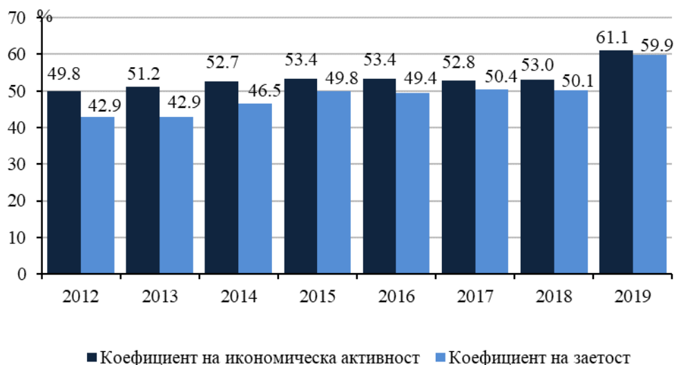
Фиг. 1. Коефициенти на икономическа активност, заетост и безработица за лицата на 15 и повече навършени години в област Велико Търново

Лицата извън работната сила на 15 и повече навършени години през 2019 г. в областта са 79.2 хил., от които 39.6% са мъже и 60.4% - жени.